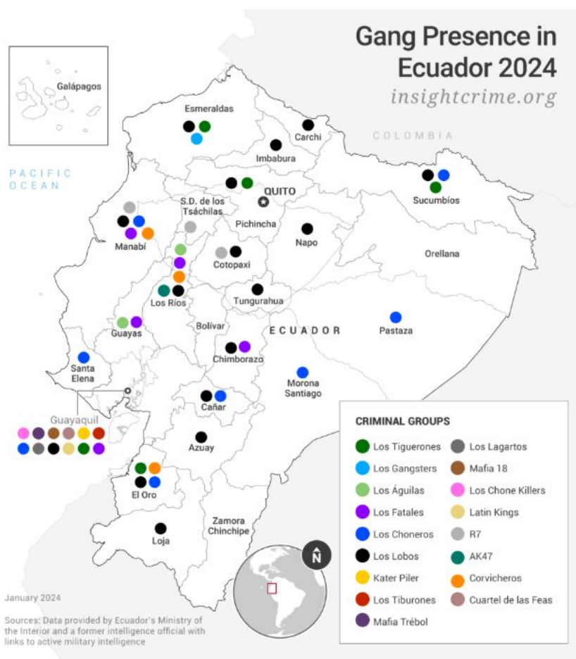
Figura 2. Presencia territorial del crimen organizado en Ecuador