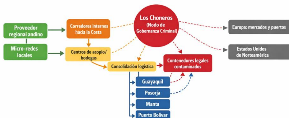
Figura 3. Red de proveedor, rutas y mercados ilícitos