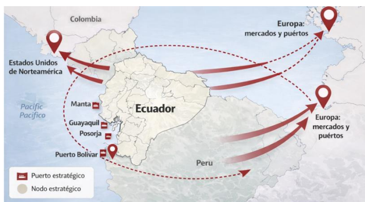
Figura 4. Mapa de Ecuador con red, rutas y mercados ilícitos asociados al tráfico internacional de drogas