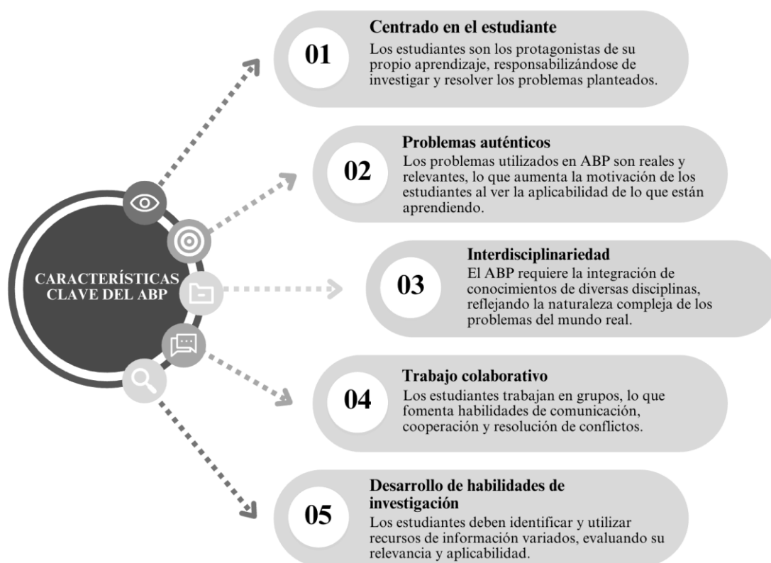
Figura 1: Características clave del ABP

Nota. La figura resalta las características clave del ABP, destacando su enfoque en el estudiante, el uso de problemas auténticos, la interdisciplinariedad, el trabajo colaborativo y el desarrollo de habilidades de investigación.